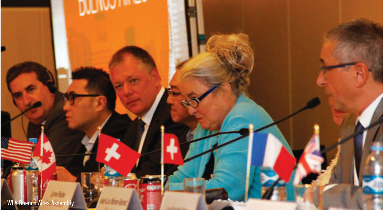
WLA Buenos Aires Assembly.