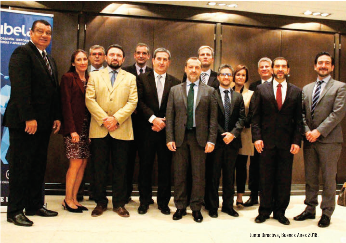
Junta Directiva, Buenos Aires 2018.