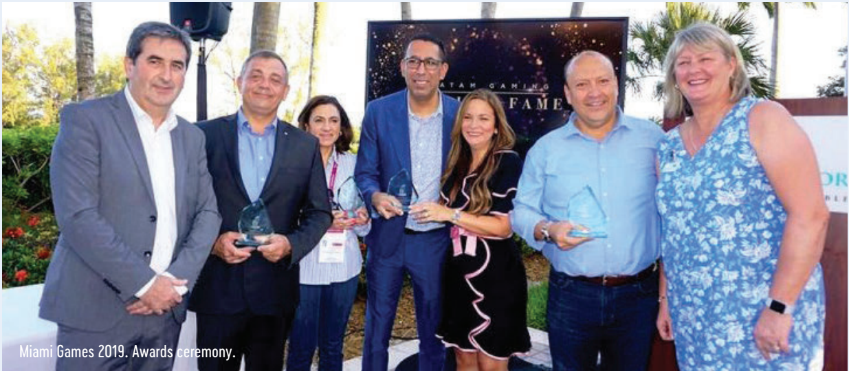
Miami Games 2019. Awards ceremony.