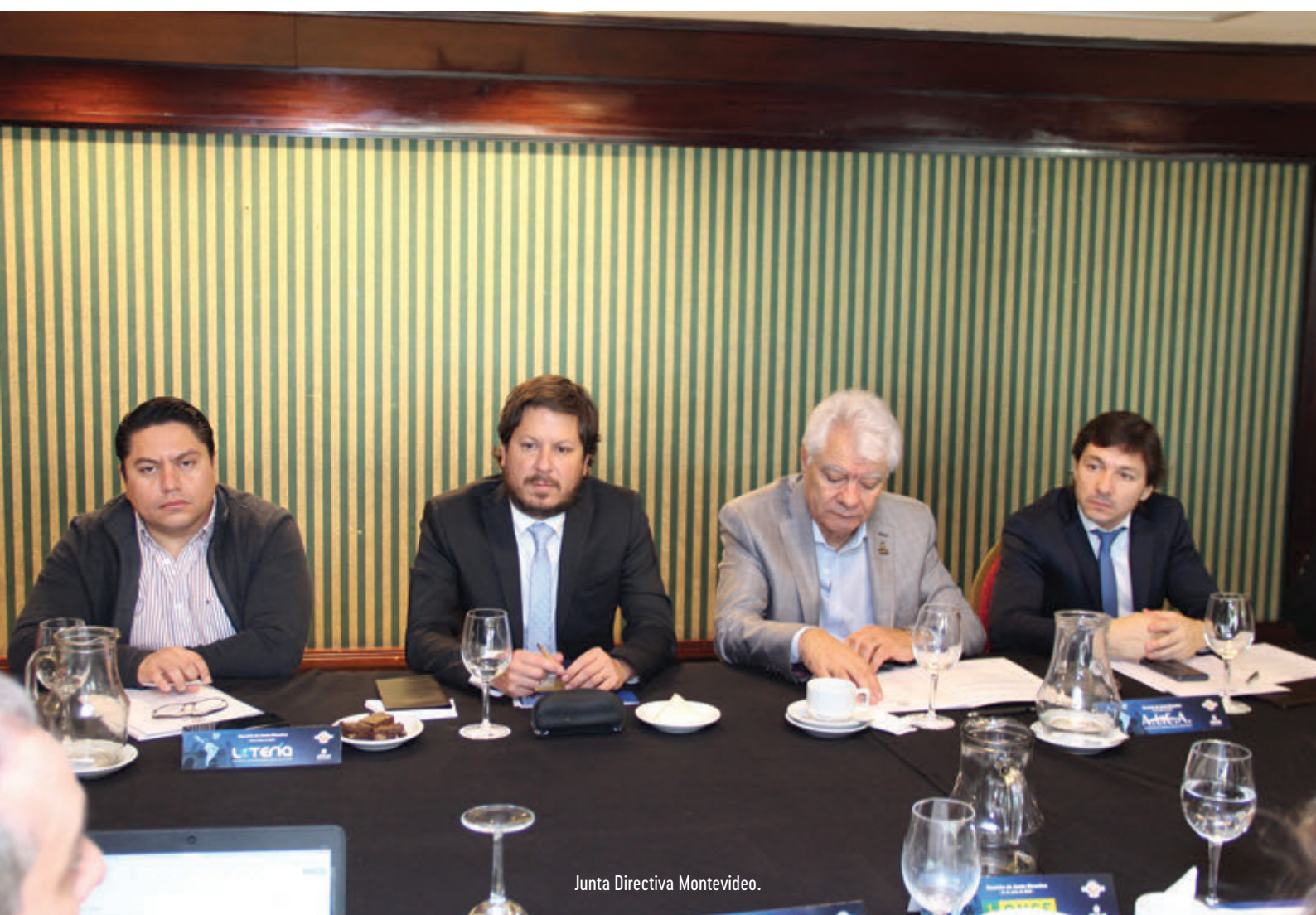
Junta Directiva Montevideo.

No final, a delegação composta por todos os membros da CIBELAE e a DNLQ comemoraram no Teatro Solís.