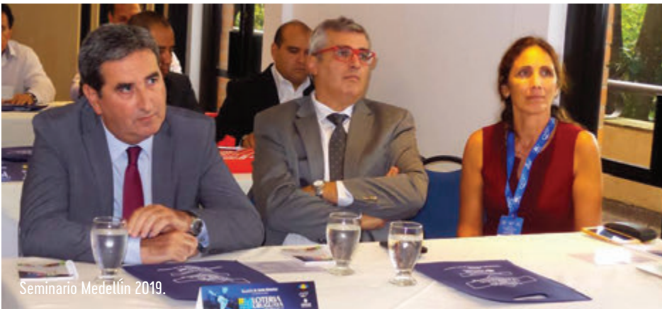
Seminario Medellín 2019.