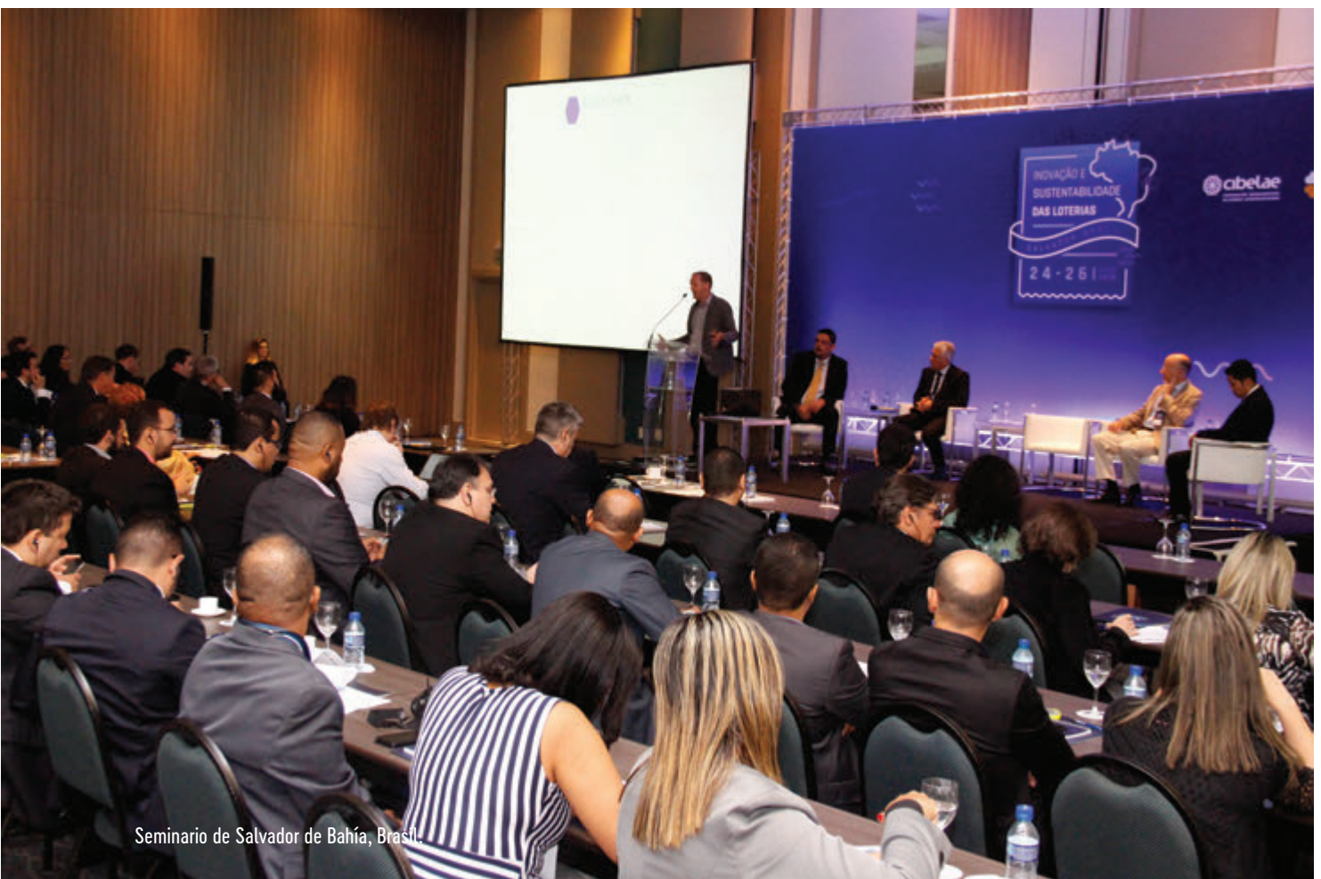
Seminário de Salvador de Bahía, Brasil.