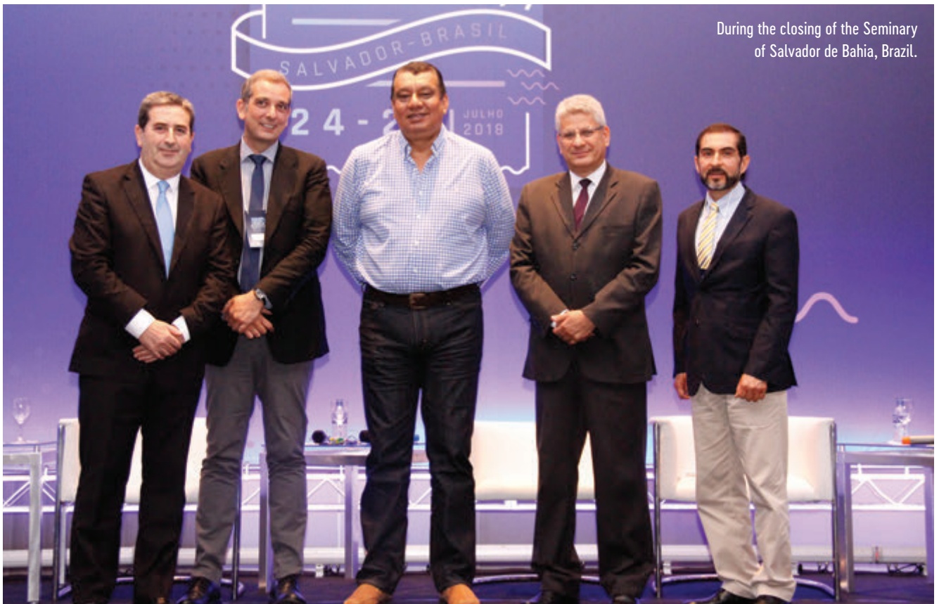
During the closing of the Seminary of Salvador de Bahia, Brazil.