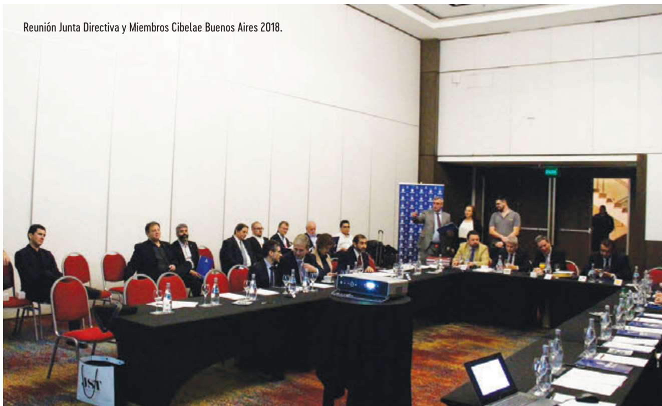
Reunión Junta Directiva y Miembros Cibelae Buenos Aires 2018.