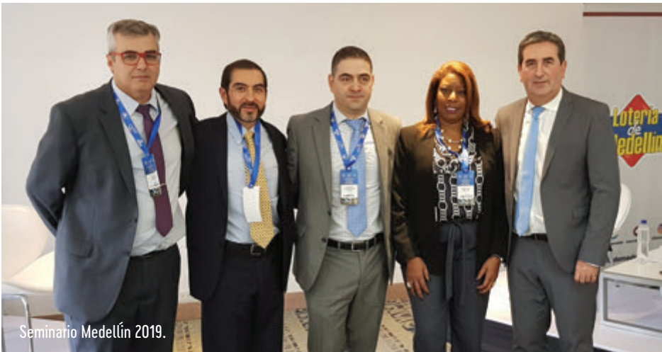
Seminario Medellín 2019.