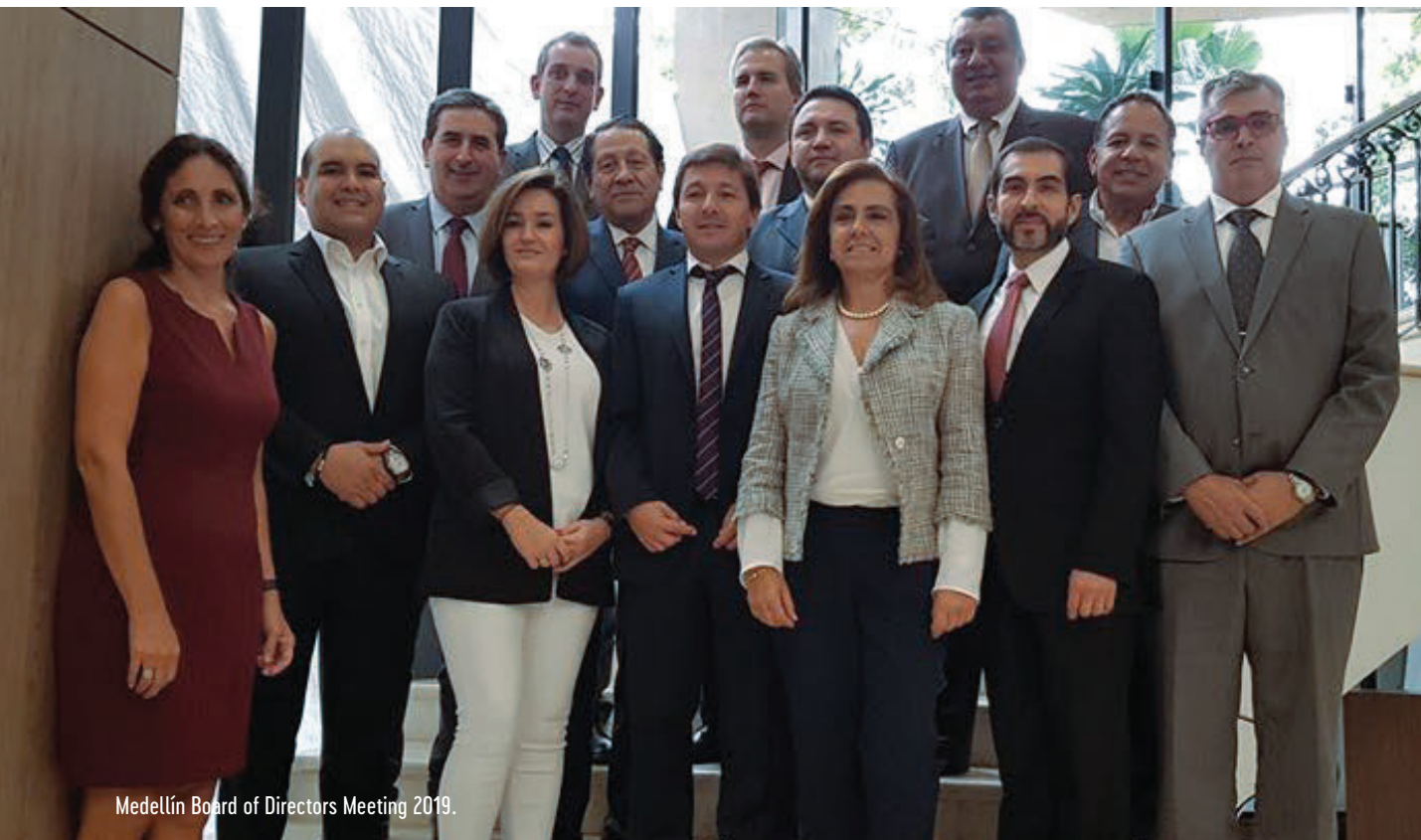
Medellín Board of Directors Meeting 2019.