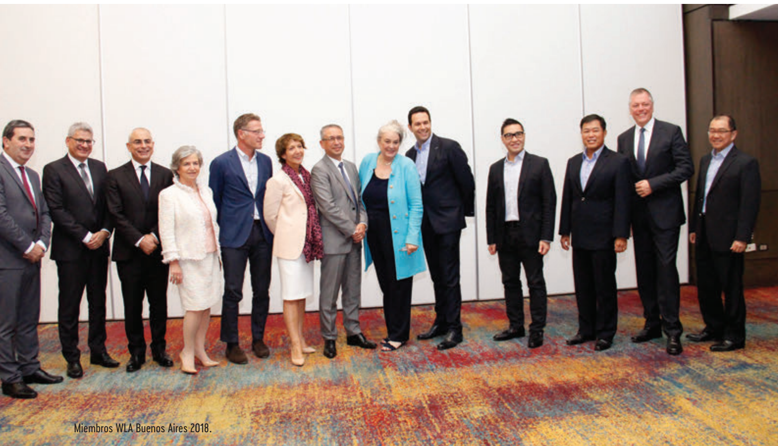
Miembros WLA Buenos Aires 2018.

presa de Comunicación. Ambos temas fueron aprobados por unanimidad.