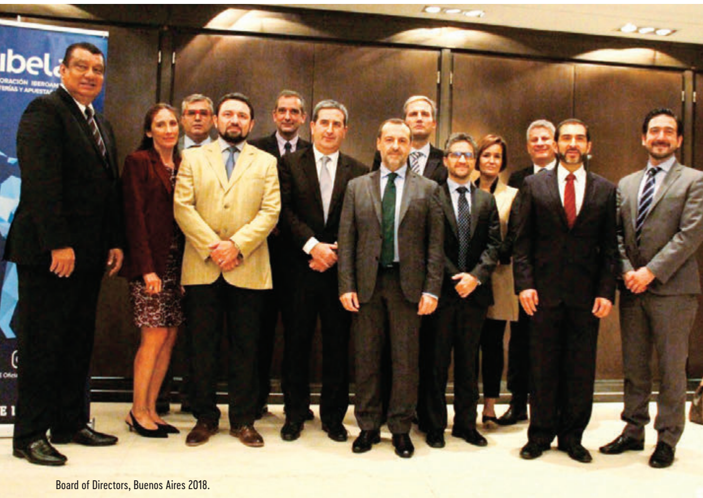
Board of Directors, Buenos Aires 2018.