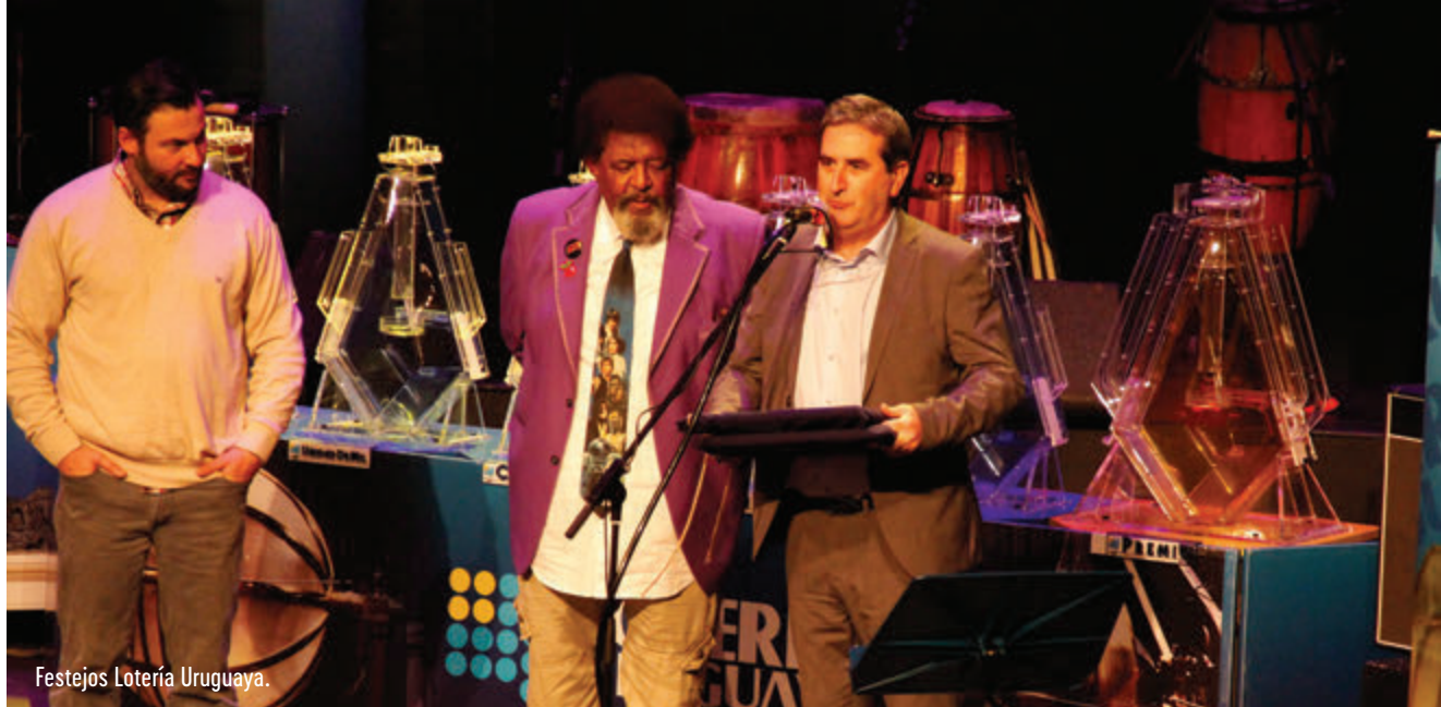
Festejos Lotería Uruguay.