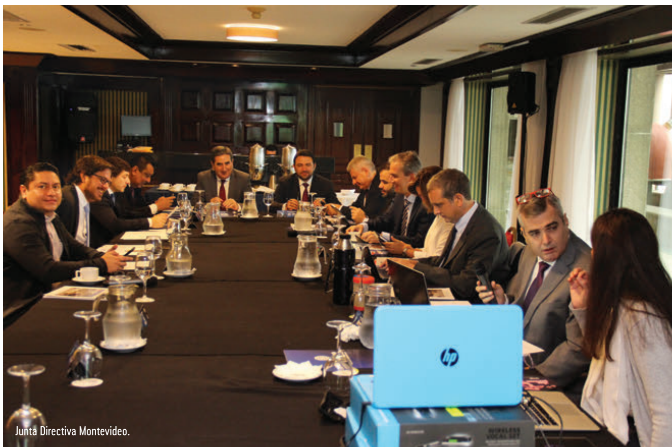
Junta Directiva Montevideo.

No nível internacional, existe um respeito, um reconhecimento e uma visão muito importante da região por parte da WLA. É um espaço que ganhamos, a Corporação recebe uma consideração especial e se torna conhecida permanentemente dentro da WLA. Nós fortalecemos a CIBELAE interna e externamente e conquistamos um lugar em nível mundial. A presidenta da WLA possui uma conexão muito especial com a região. Isso é positivo, e devemos aproveitá-lo. E repito,