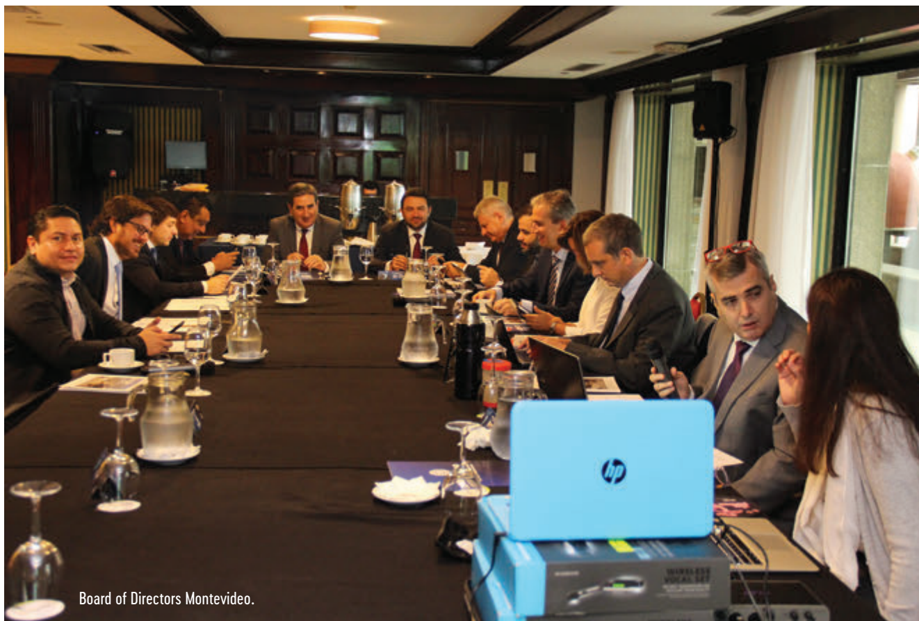
Board of Directors Montevideo.