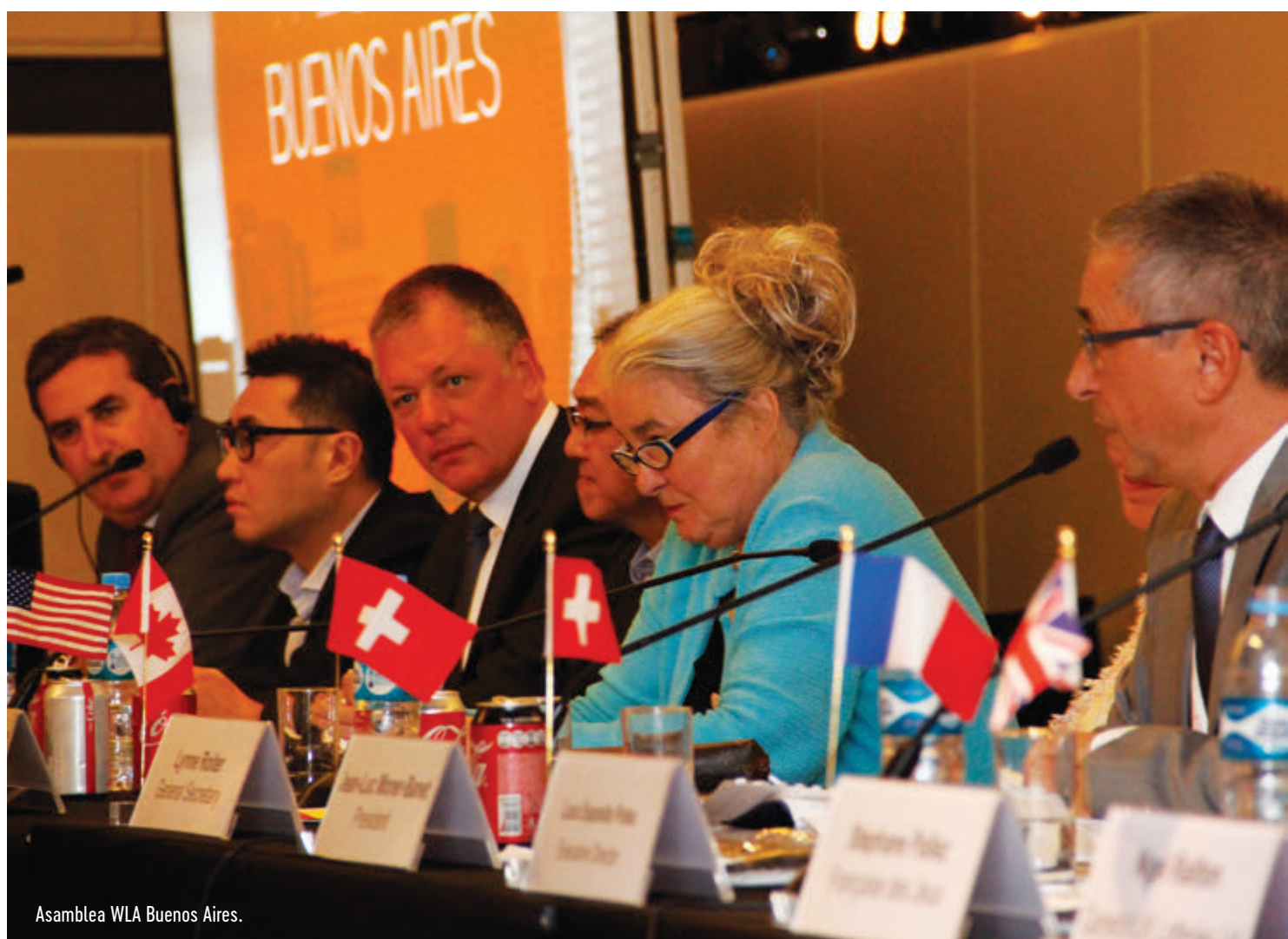
Asamblea WLA Buenos Aires.