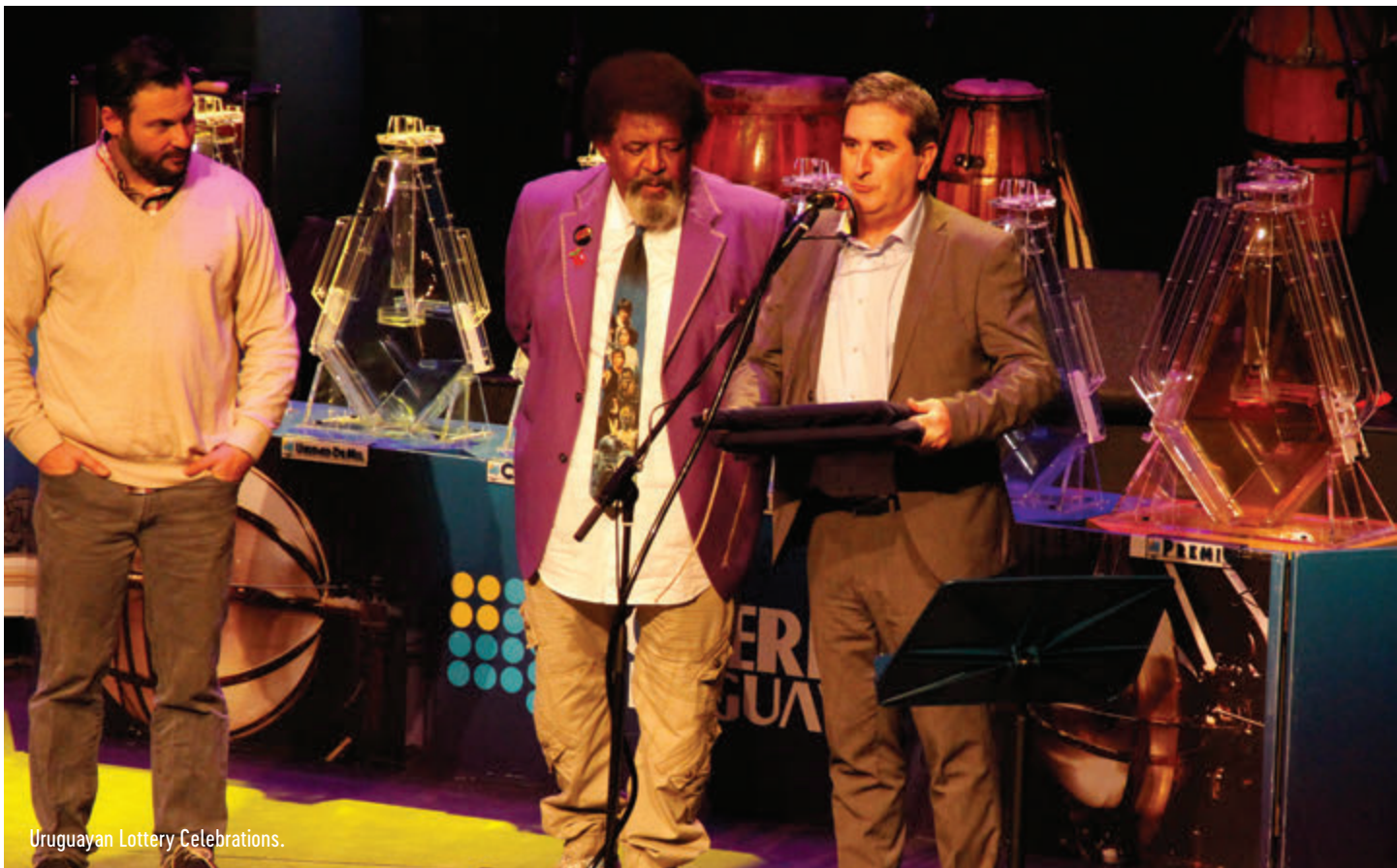
Uruguayan Lottery Celebrations.