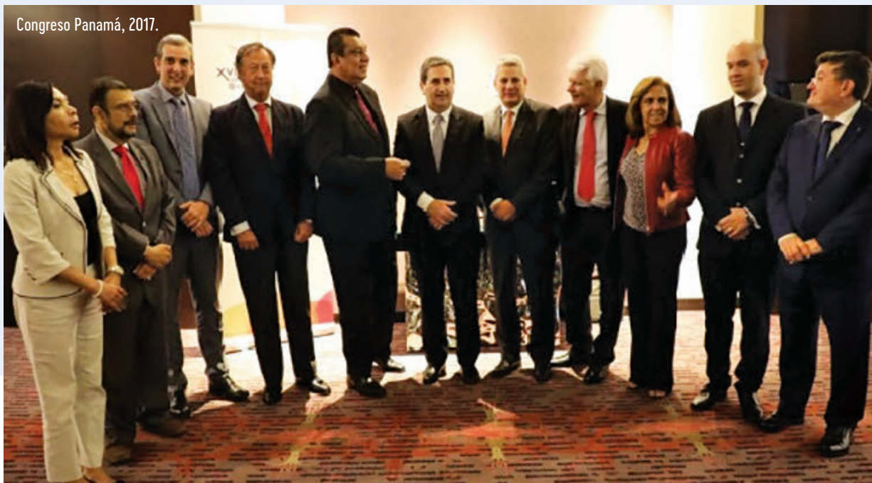
Congreso Panamá, 2017.

E na segunda-feira, dia 08 de janeiro, na cidade de Buenos Aires, foi realizada uma reunião em que participaram o presidente Luis Gama, o secretário-Geral Javier Balbuena e o diretor executivo recentemente nomeado, Rodrigo Cigliutti. Eles discutiram uma série de questões que permitem delinear e definir a atividade a ser realizada neste próximo período de gestão. Entre outras, foram abordadas questões relacionadas à participação e à consolidação dos órgãos membros da CIBELAE, o trabalho das diferentes comissões, a importância da gestão da comunicação, a atualização na elaboração de um novo plano estratégico e o planejamento da agenda para os próximos meses. Em relação ao último ponto, foram levantadas considerações sobre a próxima reunião do Conselho de Administração a ser realizada nos primeiros dias de abril na cidade de Sevilla, a reunião do Conselho e o Seminário que serão realizados no Brasil, país vizinho, durante o mês de junho e a importância da contribuição da CIBELAE para a organização de disciplinas acadêmicas nos painéis do WLA Summit 2018, com sede na cidade de Buenos Aires e que, ao mesmo tempo, também sediará a reunião do Conselho de Administração e Assembleia correspondente ao fechamento do ano.