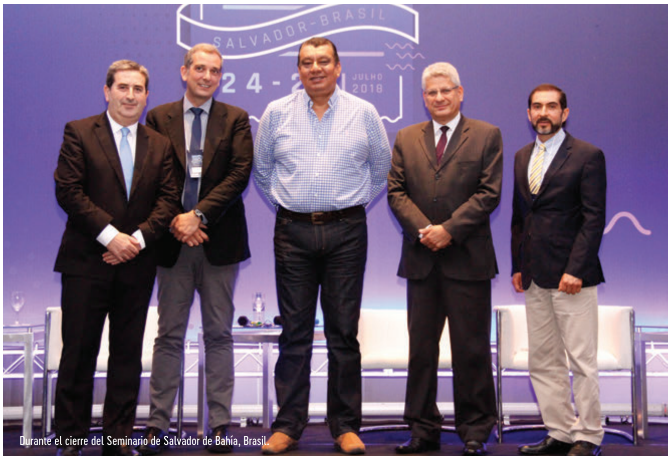
Durante el cierre del Seminario de Bahía de Brasil.

La intensa jornada de trabajo inició con un delicioso lunch de bienvenida del cual pudieron disfrutar todos los presentes. Se da inicio a la jornada de trabajo con la reunión de los miembros de Junta Directiva