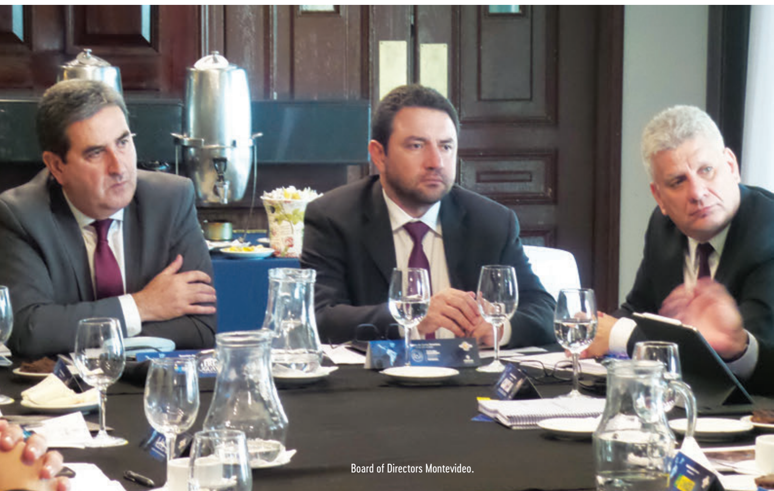
Board of Directors Montevideo.