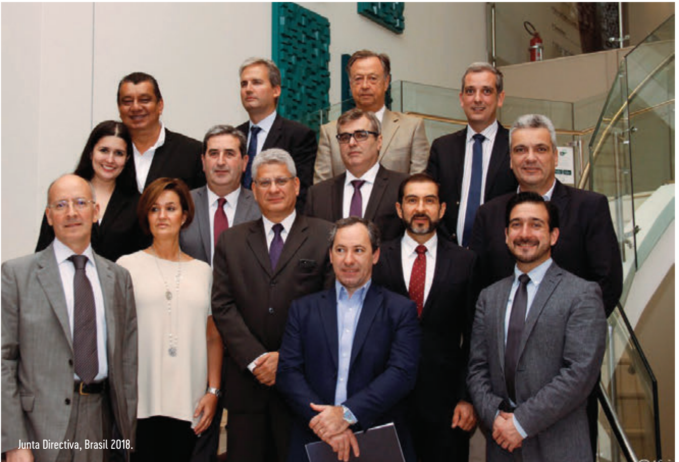
Junta Directiva, Brasil 2018.