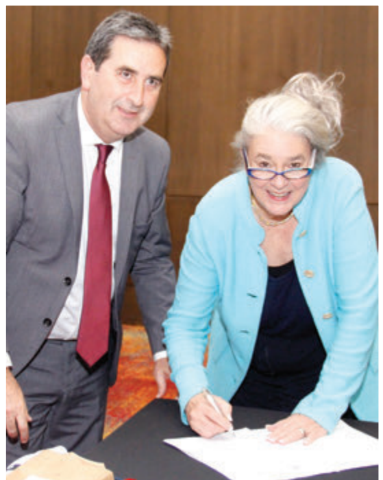
Signing of the 2018 Agreement.