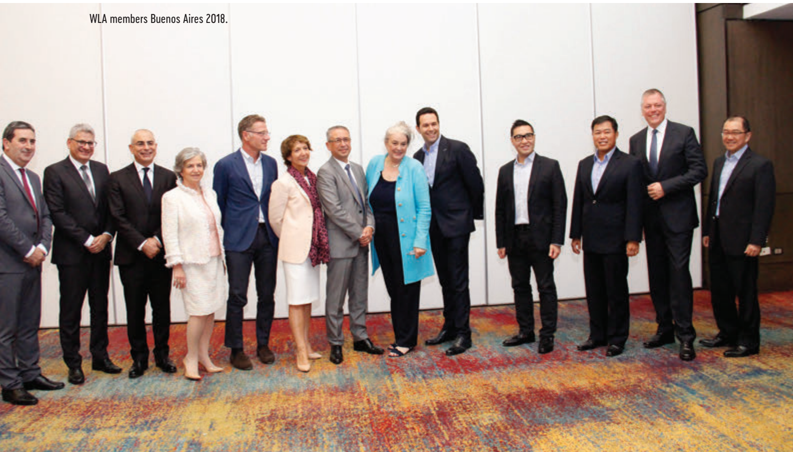
WLA members Buenos Aires 2018.