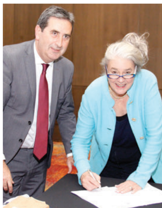
Firma del Convenio 2018.